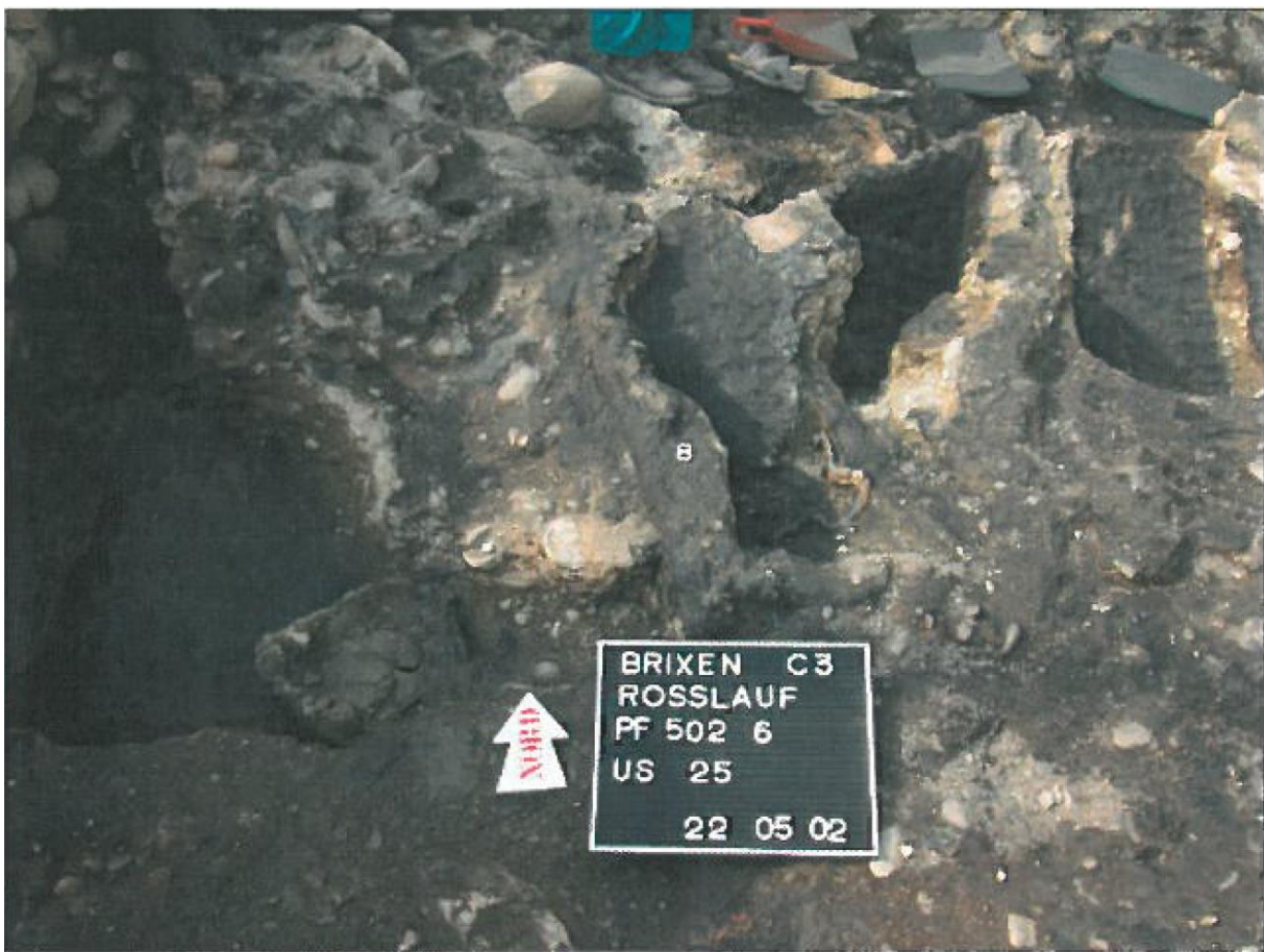
Fig. 42 Bressanone, lieu-dit: Rosslauf: habité. Détail des pierres concassées sur le sol près de l'angle nord-est de la cave.