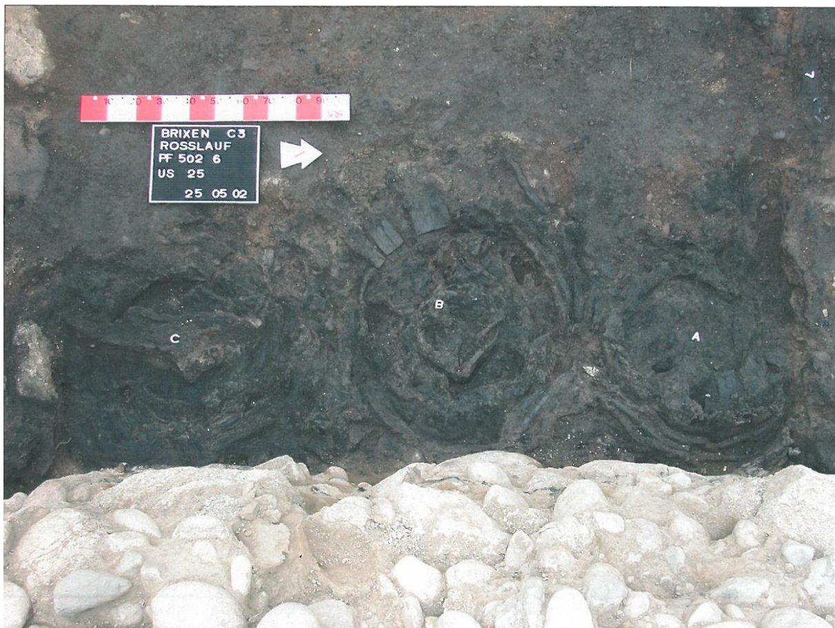
Fig. 39 Bressanone, lieu-dit: Rosslauf : habité. Les tonneaux au moment des fouilles.